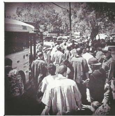
Zojuist vrijgelaten gevangenen gaan met de bus naar huis. Gemiddeld komen per dag 140 mensen vrij uit de Walls-gevangenis.

kinderen en jongeren die op school of in jeugdgevangenis worden gediagnostiseerd met 'ernstige' psychische stoornissen, krijgt 70 procent geen hulp. Van de volwassenen met geestesziekten zoals manische depressiviteit en schizofrenie, dwaalt 40 procent geheel onbehandeld door het leven – met problemen voor de samenleving als gevolg. Bijna de helft wordt op een zeker moment gearresteerd voor ordeverstoring, geweldpleging of landlopen. Een kwart van de ruim 2 miljoen gedetineerden in Amerika is psychotisch, aldus het Bureau of Justice Statistics.