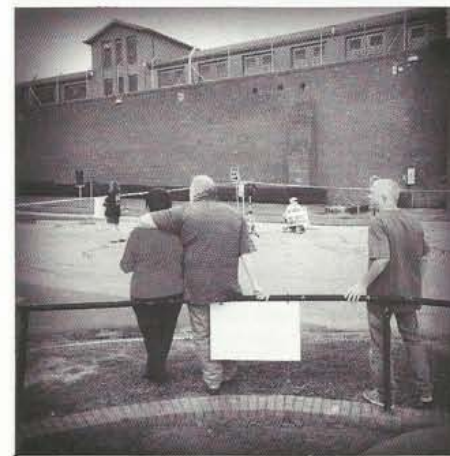
Nieuwsgierigen en een demonstrant staan te wachten op de executie van een terdoodveroordeelde in de Walls-gevangenis in Huntsville Texas.