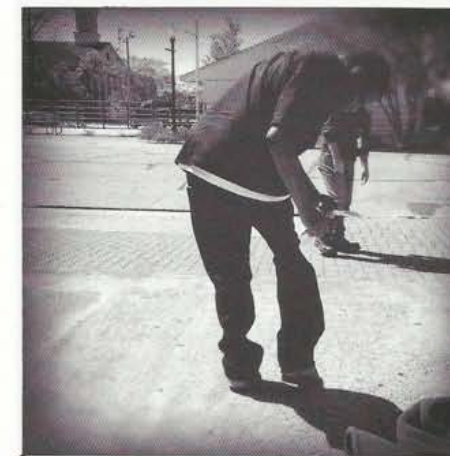
Een vrijgelaten gevangene trekt de labels van zijn zojuist gekochte kleren.

Houstons welgestelden zien les misérables (de waardelozen, red. ) alleen in het sprinkelende Theatre District. Daar draait de gelijknamige musical. Bij de kaartverkoop werd gewaarschuwd: "Bedenk u tweemaal voordat u zichzelf of uw kinderen aan deze voorstelling blootstelt. Hoewel wij goede smaak hoog in het vaandel dragen, kunnen de uitbeeldingen van bijvoorbeeld noodlijdende vrouwen in deze voorstelling als aanstootgevend worden ervaren."