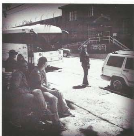
Families wachten op het busstation in Huntsville op het moment dat hun verwanten worden vrijgelaten.